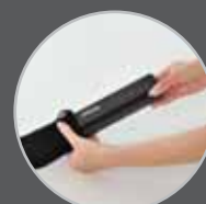
Bolsa para transporte inclusa