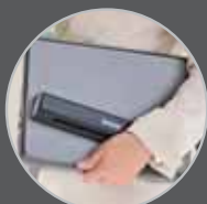
Portabilidade sem igual