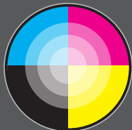
Scanner em cores