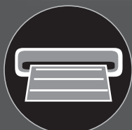
Geração de documentos PDF editáveis