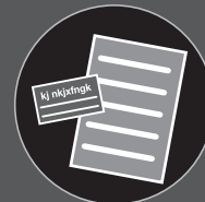
Digitalização de uma ampla variedade de documentos